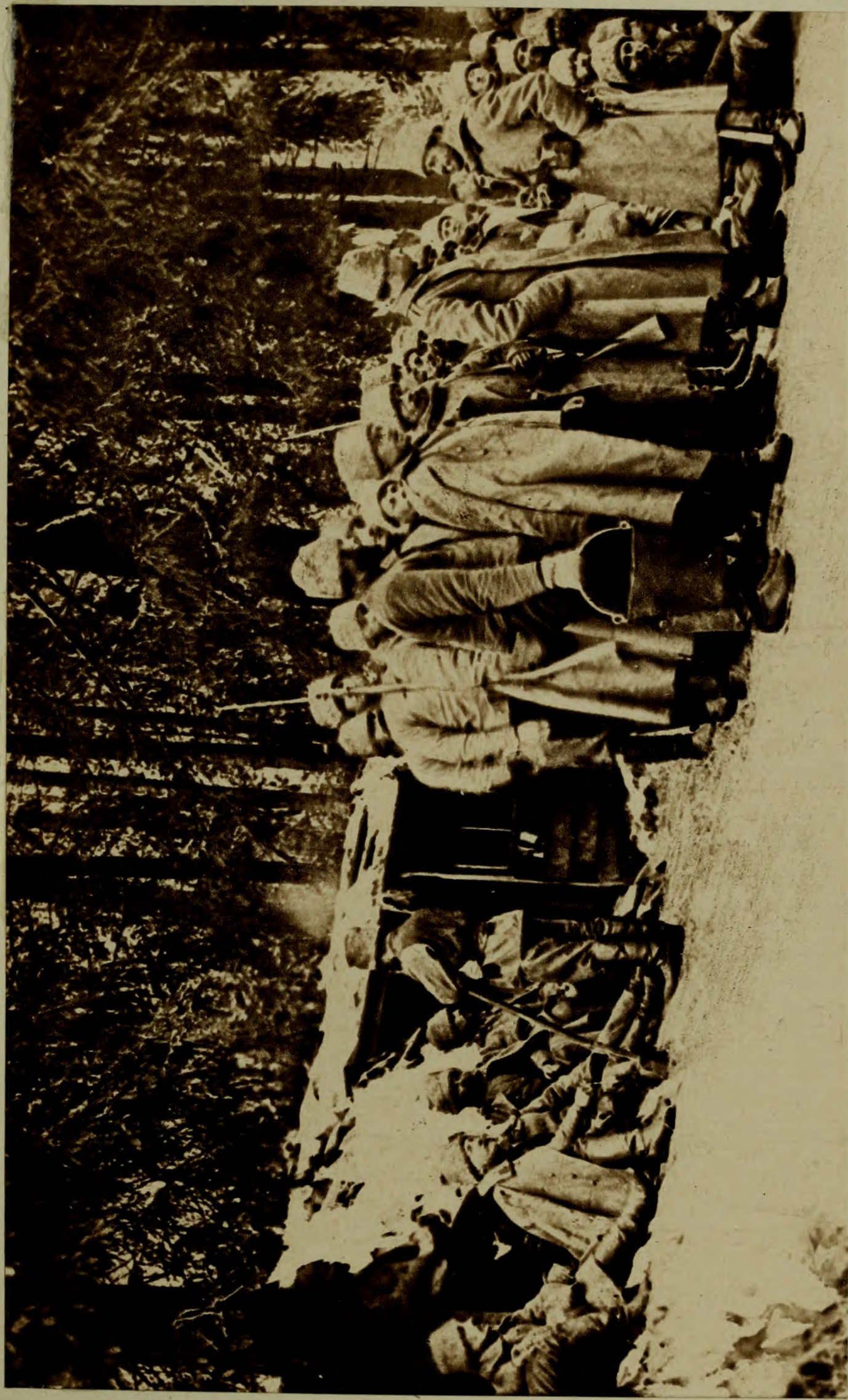
ВЪ АВГУСТОВСКИХЪ ЛѢСАХЪ.